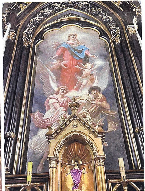
Fot.8. Obraz stan zachowania – ołtarz główny.