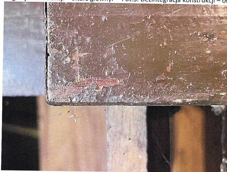
Fot.4. Gruba warstwa przemalowania olejnego – ołtarz główny.