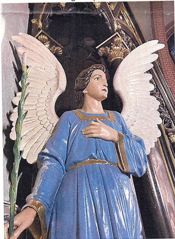
Fot.7. Rzeźba przemalowana grubą powłoką farb olejnych – ołtarz główny.