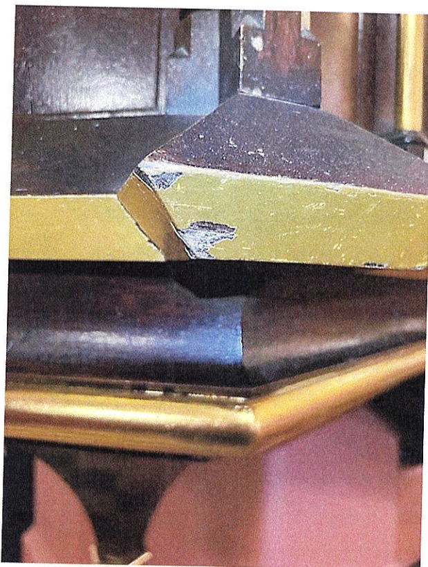
Fot.21. Uszkodzenia mechaniczne – ambona.