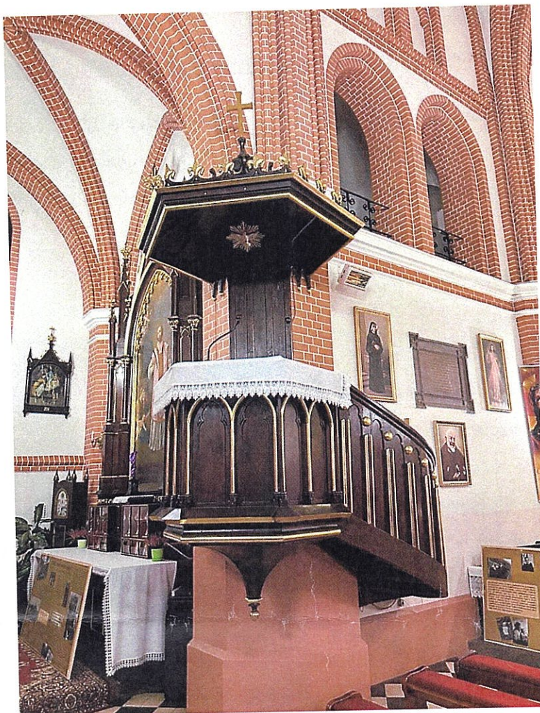
Fot.20. Ambona z kościoła pw. Wniebowzięcia NMP w Kałuszynie.