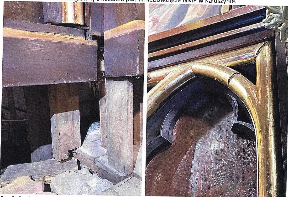
Fot.2. Dezintegracja konstrukcji – ołtarz główny.